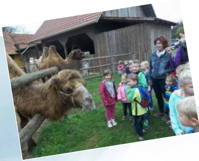
Ein herbstlicher Ausflug zum Kamelhof nach Ratschendorf.

Viele besondere Stunden konnten 30 Kinder in den letzten Wochen im Kindergarten gemeinsam erleben. Traditionelle Feste und Ausflüge wie Erntedank, Herbstausflüge und St. Martin gaben Anlass für Rollenspiele, Musikerziehung, Wertevermittlung und besonders für das Erleben von Gemeinschaft.