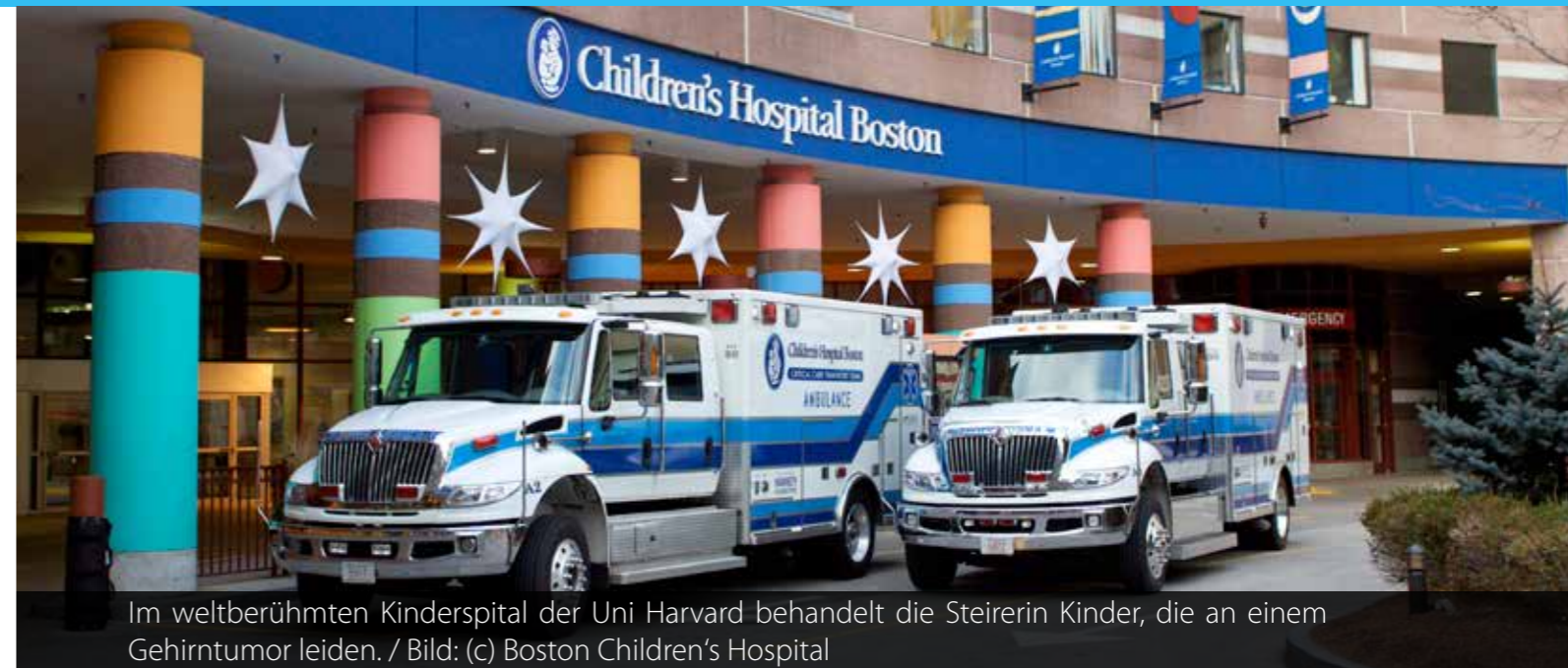
Im weltberühmten Kinderspital der Uni Harvard behandelt die Steirerin Kinder, die an einem Gehirntumor leiden.