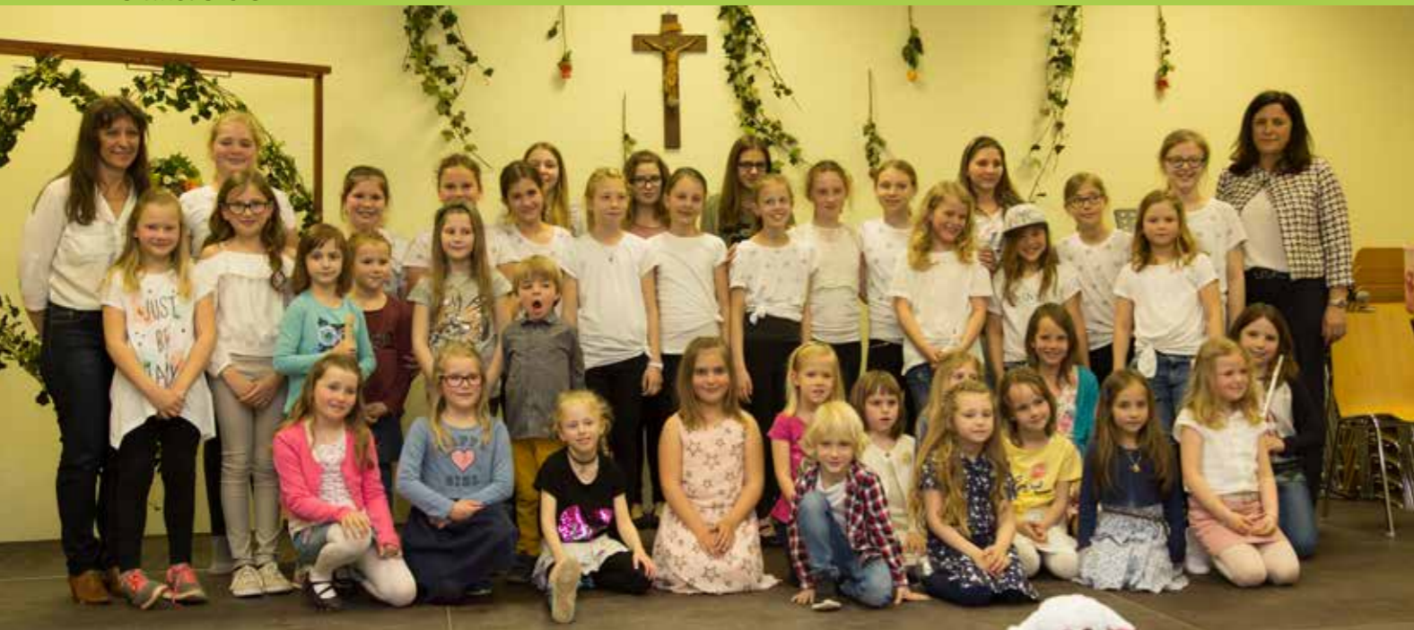
Fotos der Muttertagsfeier