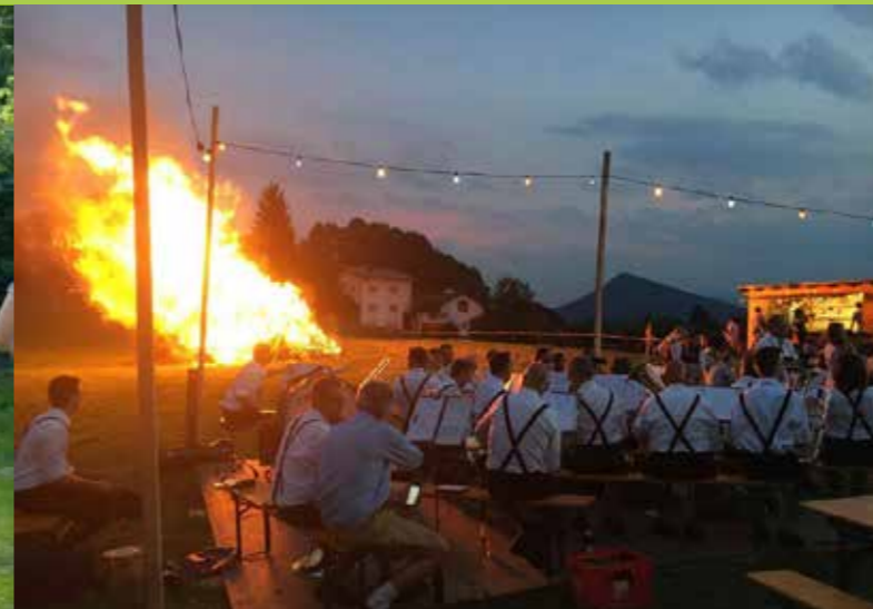
Der Einladung nach Plainfeld in Salzburg sind wir natürlich gefolgt.