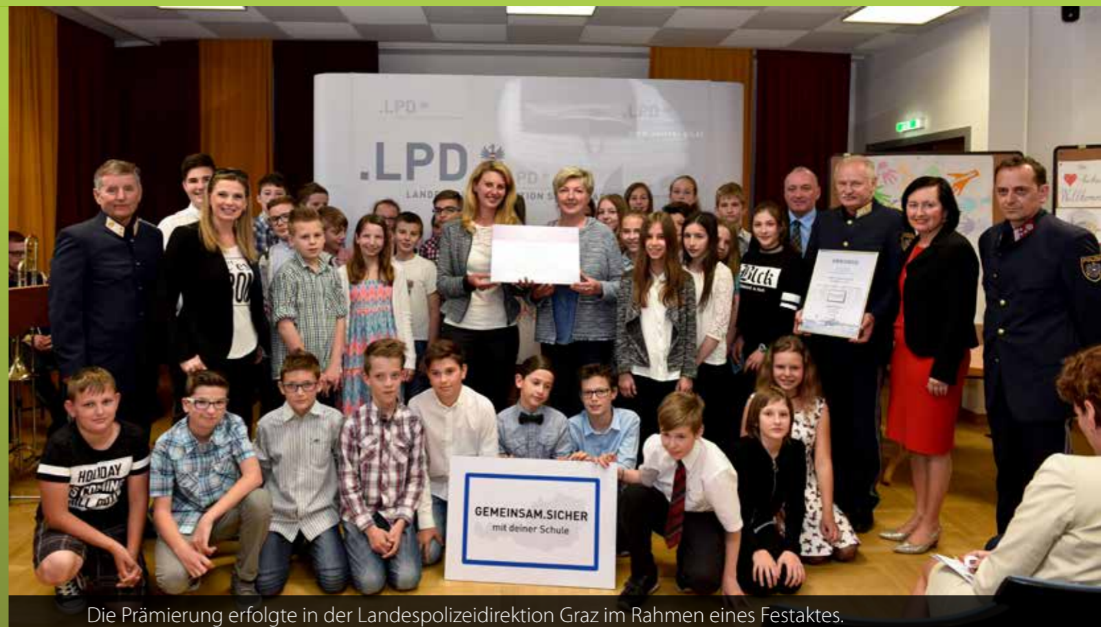
Die Prämierung erfolgte in der Landespolizeidirektion Graz im Rahmen eines Festaktes.