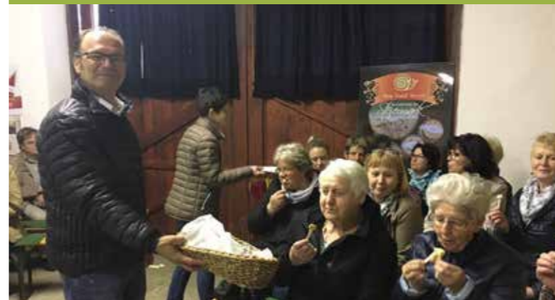
Fotos des Frauenausfluges