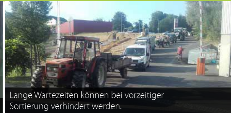
Lange Wartezeiten können bei vorzeitiger Sortierung verhindert werden.