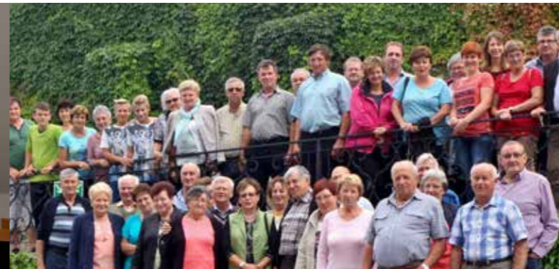
Unser Feuerwehrausflug führte heuer nach Oberösterreich.