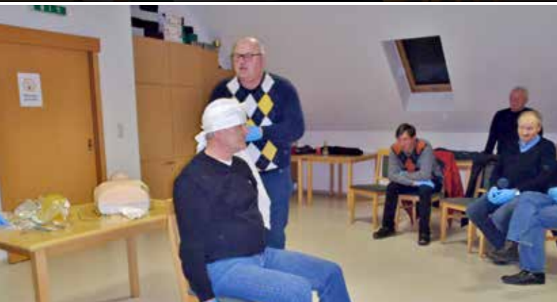
Ein Erste-Hilfe-Kurs wurde am 19. Februar abgehalten.