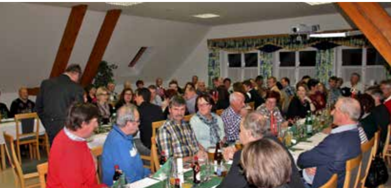
Mit einer schönen Weihnachtsfeier ließen wir das Jahr 2015 ausklingen.