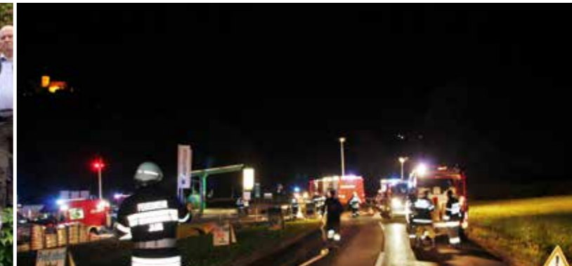
Große Abschnittsübung in St. Anna am Aigen.