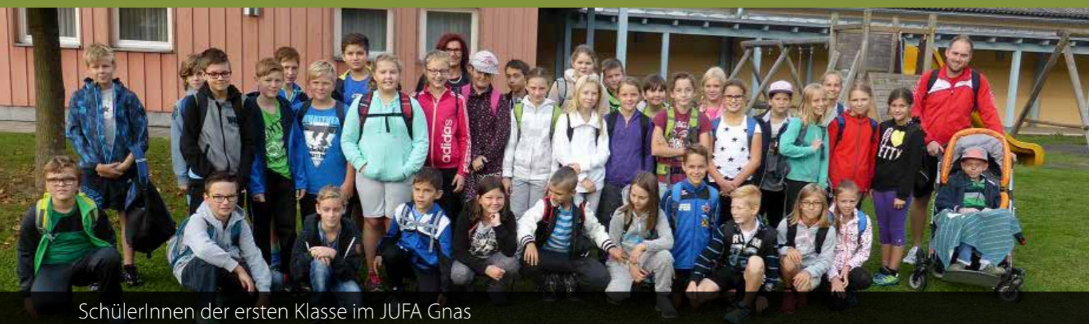
SchülerInnen der ersten Klasse im JUFA Gnas