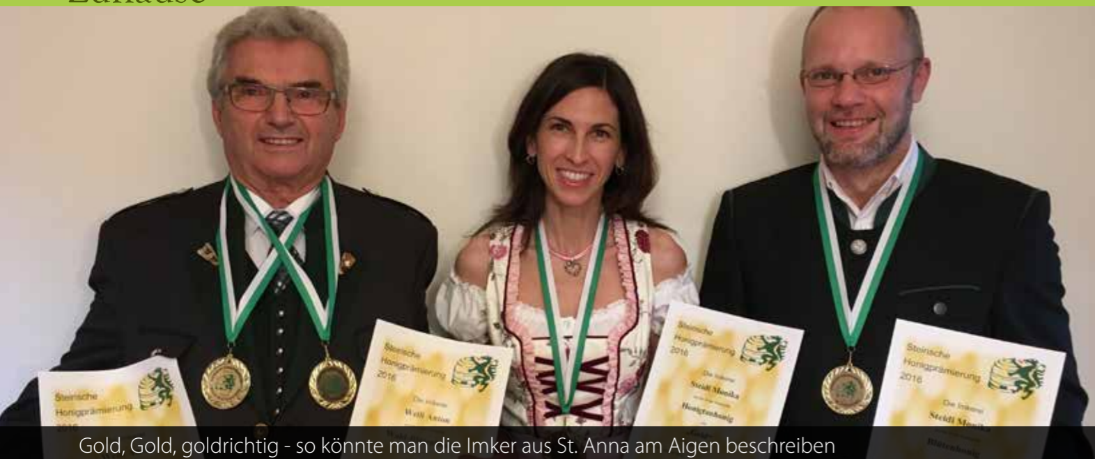
Gold, Gold, goldrichtig - so könnte man die Imker aus St. Anna am Aigen beschreiben