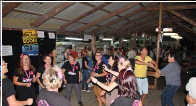
Tolle Stimmung auch heuer wieder beim Sommerfest. Die FF Jamm bedankt sich für Euren Besuch.