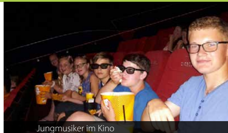
Jungmusiker im Kino