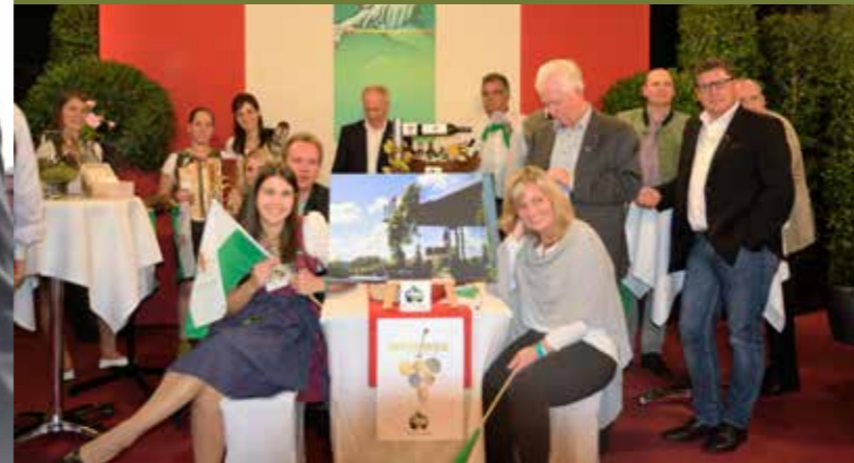
Weitere Fotos der Siegerehrung „9 Plätze - 9 Schätze“