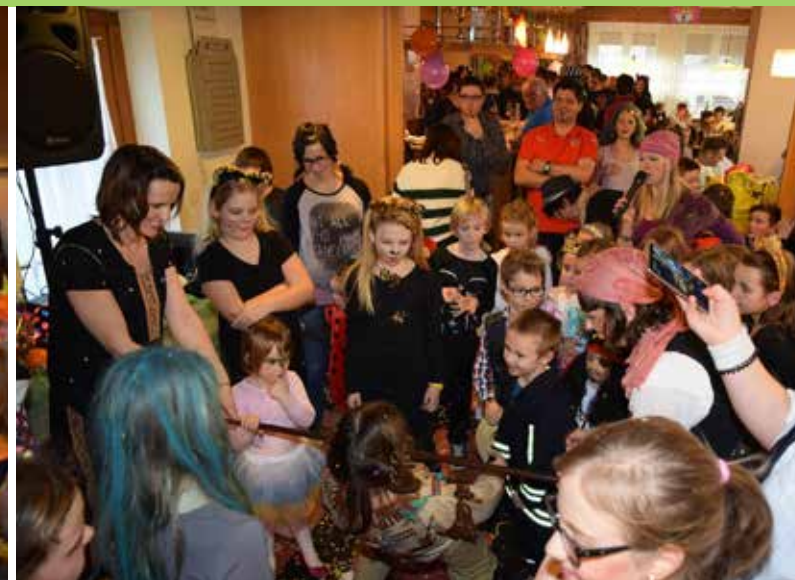
Vom Indianer bis hin zur wunderhübschen Fee war alles da – vor allem der Spaß!