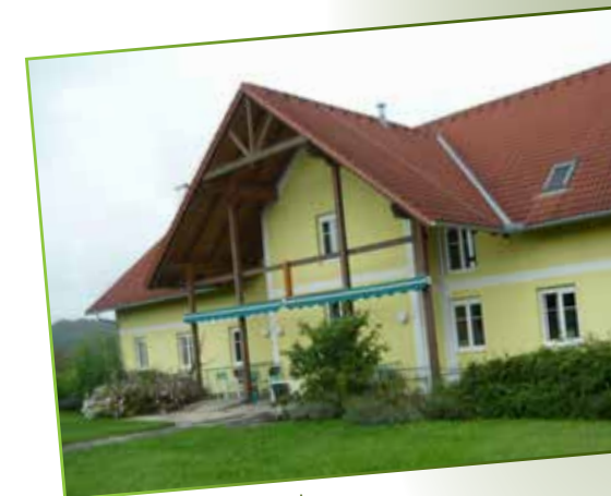
Gesundheits- und Pflegezentrum St. Anna am Aigen