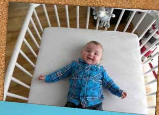
Lukas Urbanitsch 12.11.15 Sichauf 58/2 Eltern: Sandra Urbanitsch u. Gerald Urbanitsch