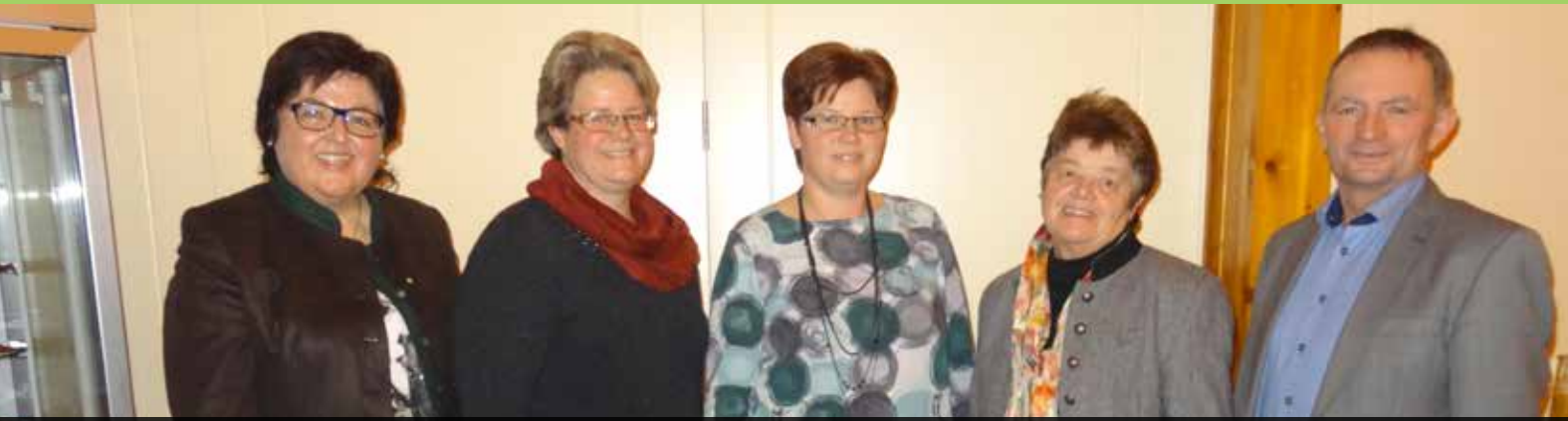
Die neu gewählten Gemeindebäuerinnen mit Vertretern der Bäuerinnenorganisation des Bezirkes