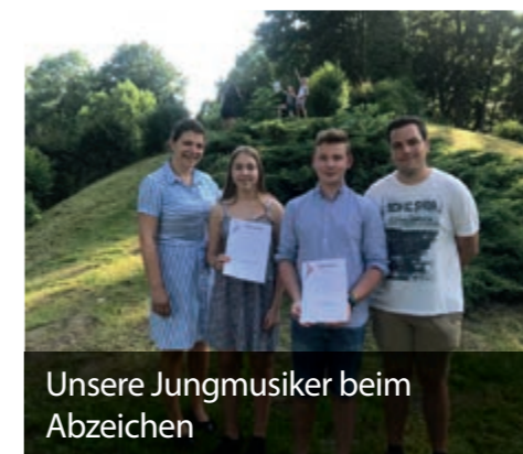
Unsere Jungmusiker beim Abzeichen