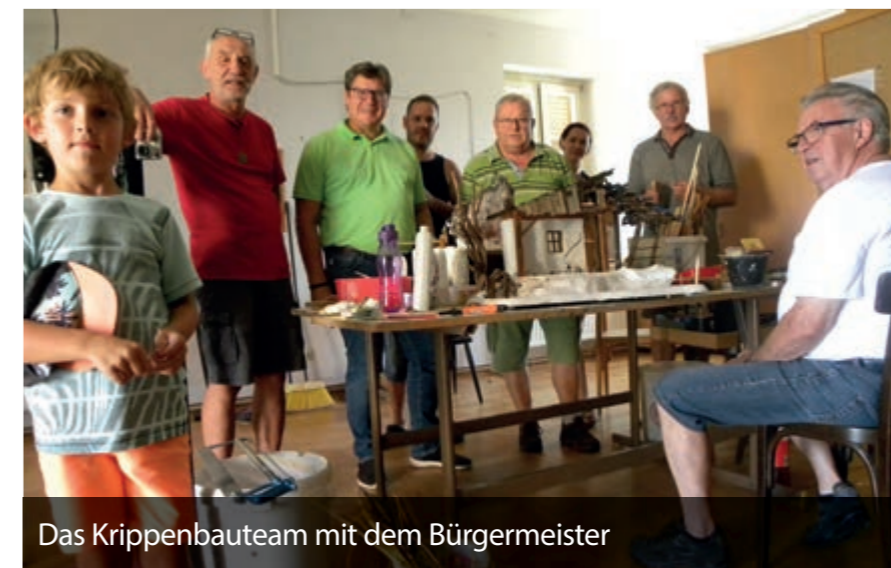
Das Krippenbauteam mit dem Bürgermeister